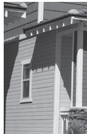
8. Dans les avant-toits