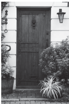
1. Entrées de porte

Veillez noter que la caméra de l'offre combinée à prix réduit requiert un boîtier résistant aux intempéries pour la protéger des éléments lors d'un usage extérieur. Une exposition directe aux intempéries annulera la garantie.