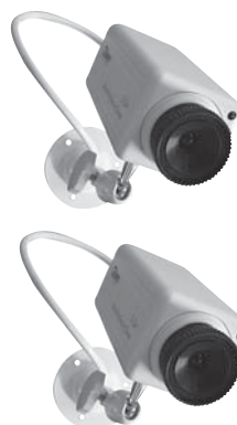
7. Combinaison de leurres et de réelles caméras