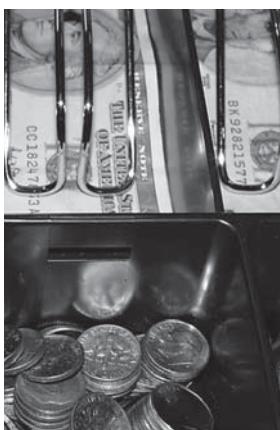
6. Caisses enregistreuses